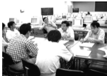
中央研修会前日の深夜 打ち合わせをする 講師・インストラクター

がお上手な先生、人を引き付ける話し方をなさる先生、受講された方お一人お一人の行動目標に、丁寧にコメントを書いておられた先生など、それぞれに工夫されていらっしゃることに驚くとともに、たいへん勉強になりました。また、多くの先生に暖かい励ましの言葉をかけていただきました。お世話になった先生方、本当にありがとうございました。